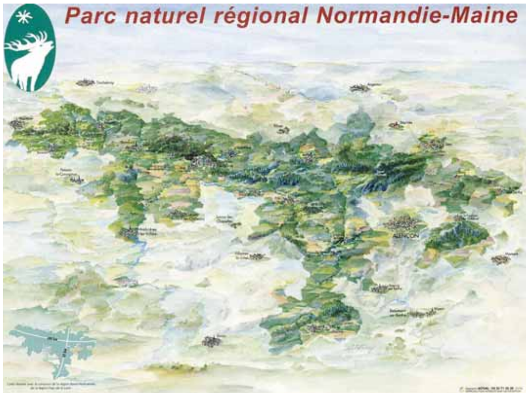
Vue à vol d'oiseau du Parc naturel régional Normandie-Maine

« Un Parc Naturel Régional (PNR) est un outil original imaginé par la DATAR en 1967 qui vise à fonder sur la protection, la gestion et la mise en valeur du patrimoine, un projet de développement pour un territoire. L'initiative de création appartient aux régions, qui s'appuient pour définir le projet sur les collectivités locales et territoriales concernées. (...)