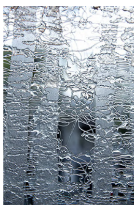
Sous-bois Sandrine Pincemaille