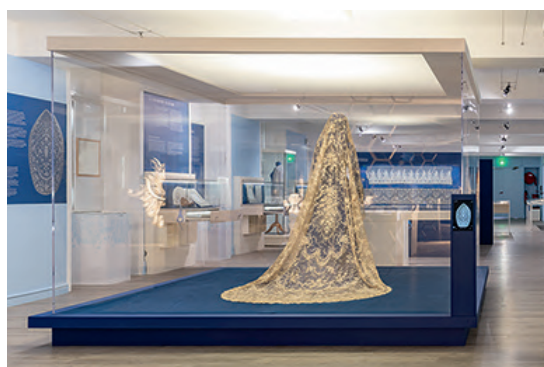
Le voile de mariée

Afin d'expliquer et de valoriser le savoir-faire de la dentelle au point d'Alençon, plusieurs outils de médiation numériques ont été réalisés et intégrés dans le nouveau parcours permanent des collections du musée des Beaux-arts et de la Dentelle :