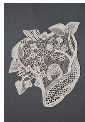
L'art des dentellières