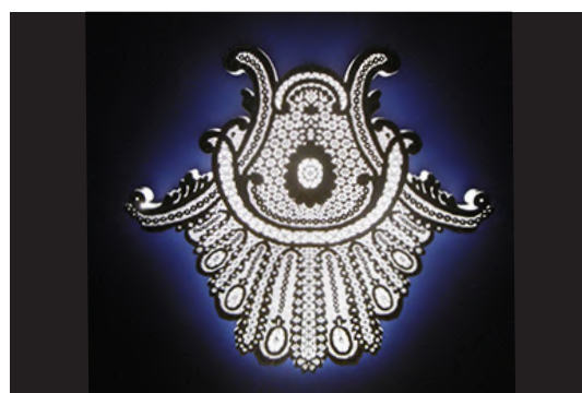
Lampe aux motifs de dentelle au Point d'Alençon NeSpoon, 2019